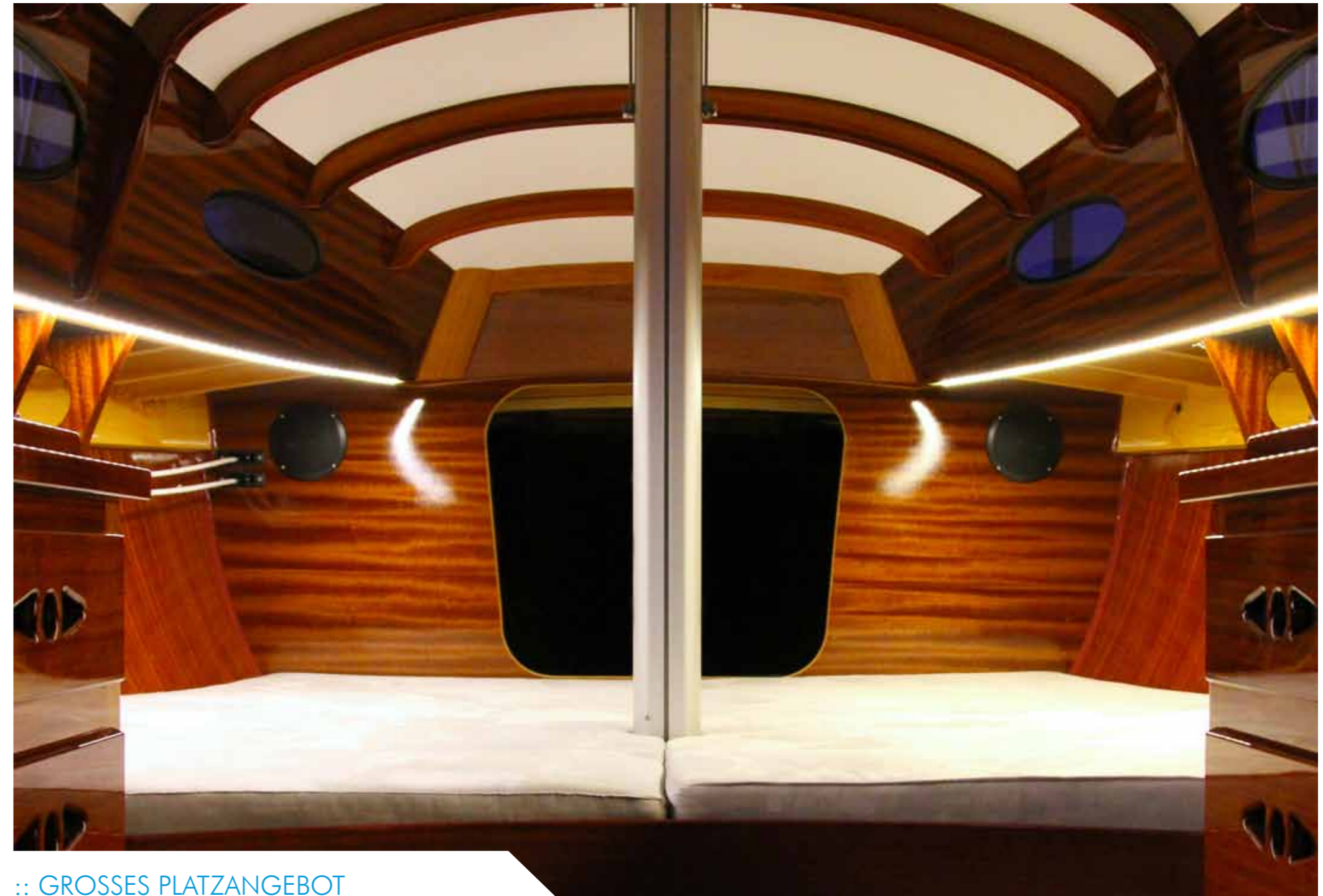
:: GROSSES PLATZANGEBOT